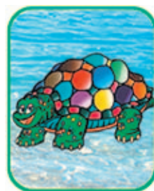
Schilda, die Schildkröte