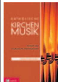
Für qualitativvolle Messgestaltung

Das Buch „Katholische Kirchenmusik. Praxis und liturgische Hintergründe“ von Peter Planyavsky bietet einen Überblick über alle Formen, Bausteine und Typen von Kirchenmusik für die Heilige Messe, aber auch für Stundengebet, Andachten und Totengedenken. Dazu kommt ein Kapitel über das Kirchenjahr als Ganzes – und 600 Jahre musica sacra im Zeitraffer. Für eine Liturgie, der es nicht um das erstbeste passende Lied geht, sondern die den inneren Zusammenhänge nachgeht und die gesamte Musik als Partnerin ansieht. Erschienen im Tyrolia-Verlag, Preis: € 29,95.